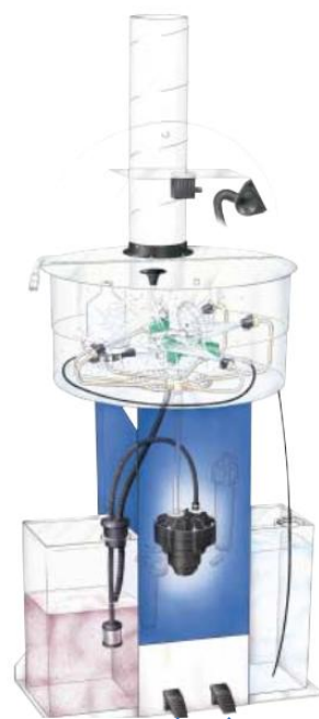
Pedāļi manuālai automātiskai mazgāšanai

Drester 3600 ir aprīkots ar jaudīgu Drester Teflona Diafragmas sūkni efektīvai instrumentu mazgāšanai automātiskā režīmā. Automātiskā mazgāšana sākas nospiežot pedāli un ilgst apmēram 1.5 min. šķīdinātājam cirkulējot.